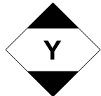
Muster 2 Größe 10 x 10 cm

Spätestens ab dem 01.07.2015 sind die gem. ADR 2011 Kapitel 3.4 vorgeschriebenen Kennzeichnungen für die in begrenzten Mengen verpackten gefährlichen Güter, als Ersatz für die Raute mit der Aufschrift „LQ“ auf dem Versandstück anzubringen. Mit Ausnahme für die Luftbeförderung müssen die Versandstücke nach dem links abgebildeten Muster 1 gekennzeichnet werden. Für die Luftbeförderung ist die Kennzeichnung nach Muster 2 anzubringen. In diesem Fall gilt die Kennzeichnung gleichwertig und muss nicht zusätzlich für den Straßentransport nach Muster 1 gekennzeichnet werden.